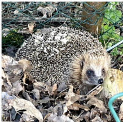
Einer der ausgesetzten Igel