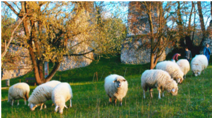
Romantisch: die Schafe vor den Römersteinen – mitten in Mainz.

Die Sachen schimmeln einfach zu schnell, deswegen bitte nichts bringen und die Schafe auf keinen Fall füttern.