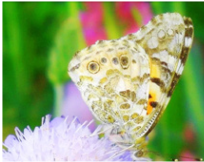
Die Schönheit liegt im Kleinen – Im Naturschaugarten erleben

NaSchau, das steht für den Naturschaugarten Lindemühle in Mainz-Bretzenheim. Und es steht für fast 18 Jahre ehrenamtliche Pflege in der Anlage. Der kleine Verein Arbeitskreis Naturnahes Grün möchte mit heimischen Pflanzen zeigen, dass Artenschutz gerade in Gärten und Grünanlagen gut umsetzbar ist.