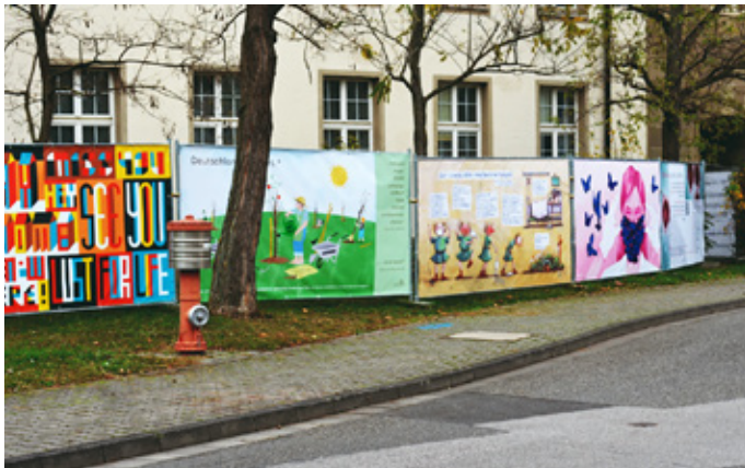
Kunstwerke an der Mainzer Uni

Corona – das Virus hält unsere Gesellschaft fest im Griff. 14 IllustratorInnen und KünstlerInnen aus der Region Mainz/Wiesbaden greifen mit ihrer Open-Air-Installation „Kunst am Bauzaun“ auf dem Campus der Johannes Gutenberg-Universität Mainz unterschiedliche Facetten der Pandemie auf.