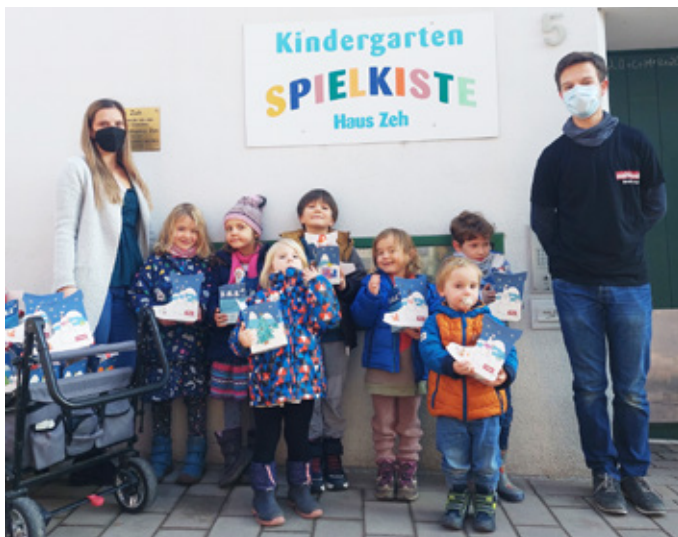
Eine Aktion mit Beispielcharakter