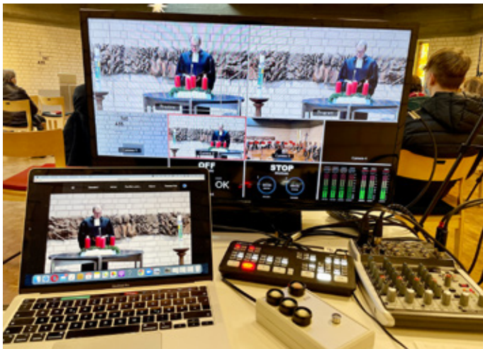
Bestens vorbereitet auf Online-Gottesdienste: Philippus

Doch dann traf bekanntermaßen zunächst die Delta-, schließlich die Omikronvariante auf eine coronamüde und viel zu impfkritische Bevölkerung. Nun stehen wir im Allgemeinen wie im Speziellen vor dem altbekannten Problem: Es gilt das Unplanbare zu planen.