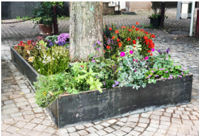
So könnte eine Bepflanzung der schon sanierten Baumscheibe aussehen.

Das Ziel ist hoch und dennoch nicht unerreichbar: zur Sanierung der Baumscheiben „Am Gänsmarkt“ unterstützen Bretzenheimer BürgerInnen die Spendenaktion der Nachhaltigkeitsinitiative Bretzenheim tatkräftig. Bereits über 7000 € sind auf dem Konto eingegangen und somit mehr als ein Drittel des aufgerufenen Betrages von 20.000 €. Es ist ein Gemeinschaftsprojekt aller Bretzenheimer, das die Initiative für 2022 an den Start gebracht hat. In Anbetracht der Bedrohungen durch Klimawandel und Artenschwund, von denen auch Bretzenheim nicht verschont wird, hat die Gruppe zusammen mit der hiesigen Mainzer Volksbank (MVB) eine Crowdfunding-Aktion gestartet, bei der Geld für die Sanierungsmaßnahmen der Baumscheiben „Am Gänsmarkt“ gesammelt wird.