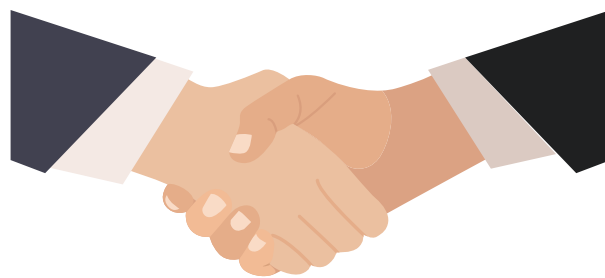
Der verbindliche Handschlag ist immer noch das Symbol für vertrauensvolle Zusammenarbeit.

Wir laden alle Einwohner zum monatlichen öffentlichen FORUM ein, das im Moment im Internet auf ZOOM* stattfindet: jeden 1. Dienstag im Monat um 19 Uhr. Wir freuen uns auf Ihre Teilnahme, auf konstruktive Dialoge, auf Ihre Ideen und auf Ihre Beteiligung an der integrierten Redaktionskonferenz des KURIER. Bringen Sie sich mit Ihren Ideen, Meinungen und Verbindungen ein zum Wohle Bretzenheims!