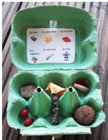
Eine der aufregenden Schatzkisten

Der Tag auf der Ziegelei war einer von zahlreichen Workshops, die der Förderverein der Grundschule organisiert hatte. In vergangenen Jahren zuständig für die Arbeitsgemeinschaften, trauten die engagierten Eltern sich in diesem Herbst nicht an Veranstaltungsreihen heran, die über das gesamte Schulhalbjahr regelmäßig stattfinden. Zu ernüchternd waren im letzten Jahr die Erfahrungen, als mit viel Begeisterung geplante AGs aufgrund der Corona-Situation am Ende doch nicht stattfinden konnten. „Gezahlte Beiträge muss-