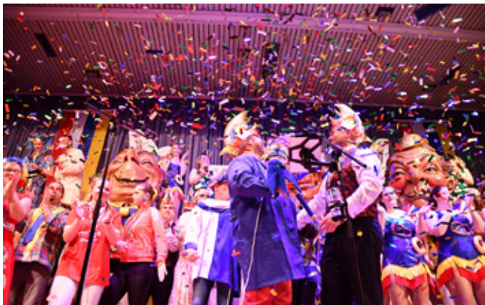
Wie es mal war – und wie es wieder wird!