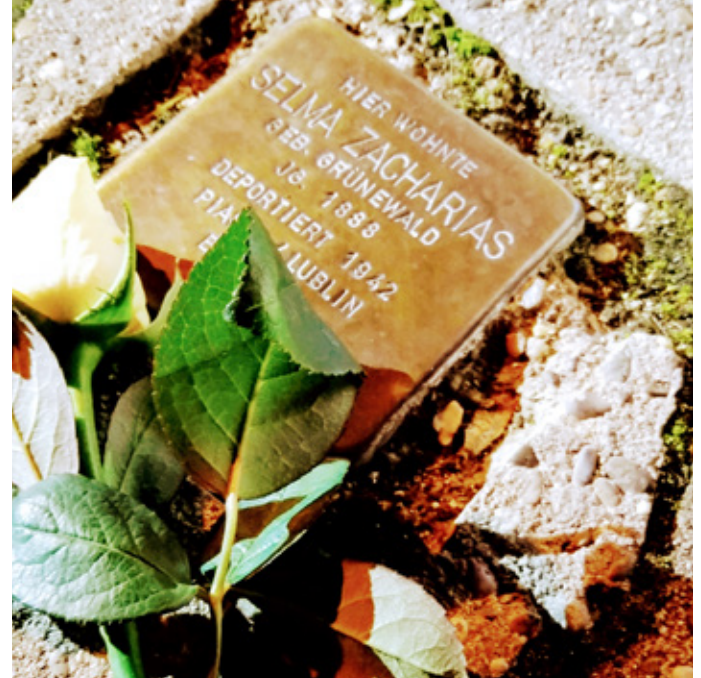
Einer der Stolpersteine für ehemalige Bretzenheimer MitbürgerInnen

Aus meiner Sicht ist es wichtiger denn je, dass wir uns immer wieder den Stellenwert dieser Ereignisse ins Bewusstsein rufen. Die Generation der Überlebenden und Zeitzeugen wird nur noch eine kurze Zeit selbst Stellung beziehen, dann stehen uns ausschließlich Geschichtsbücher und die weitere, ohne Frage wichtige, wissenschaftliche Betrachtung zur Verfügung.