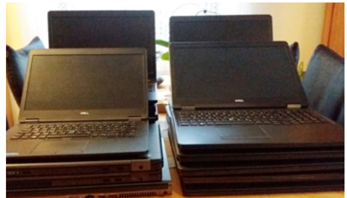
Es werden noch viele Laptops für unsere Schulen benötigt.