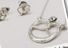
2) Der neue Schmuck der Brezelhoheiten: Geschaffen und gesponsort von Melanie Henke Die Schmuckwerkstatt