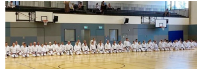
Karate-Dojo Jubiläumslehrgang 2022