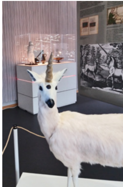
Einhorn nach spätantiken Quellen, mit magischem Karfunkelstein auf der Stirn