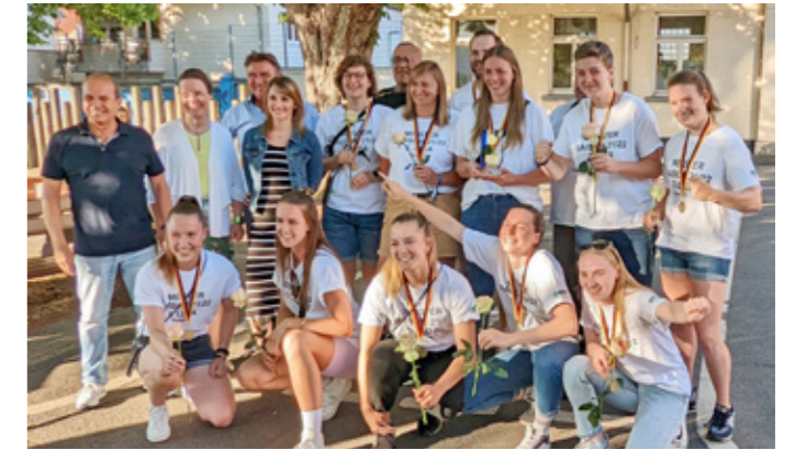
Beste Laune beim SportlerInnen-Empfang