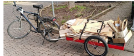
Auf dem Weg zum Wertstoffhof!