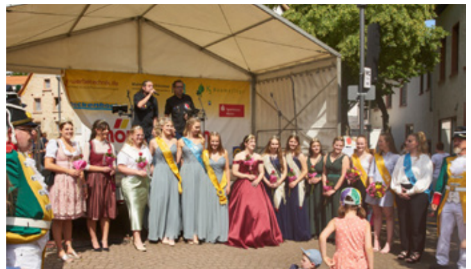
Die neuen Brezel-Majestäten mit ihren gekrönten Gästen zum Abschluss vor der Bühne

Die mit vielen verschiedenen Ständen ausgestattete Festmeile mit einer Bühne an jedem Ende lud zum Flanieren ein, in den geöffneten Höfen erlebten die BesucherInnen das Bretzenheim-Flair, und der neue kleine Künstlermarkt oben auf dem Platz vor St. Georg lud mit einem heimeligen Ambiente und Mitmach-Aktivitäten zum Verbleib ein.