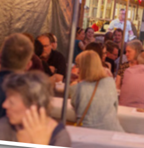
1) 10. Juni 2022, 17:58 Uhr: gleich geht es los!