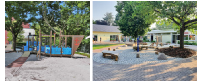
Großzügiges Angebot in barrierefreier Umgebung

Als einer der ersten Sonderkindergärten in Rheinland-Pfalz wurde die HOPPETOSSE (früher: Therapeutische Tagesstätte) im Jahr 1970 gegründet und bereits seit 1984 in einen integrativen Kindergarten weiterentwickelt. So verfügt unsere Einrichtung über eine 30-jährige Erfahrung und Tradition in der qualifizierten Integration von Kindern mit und ohne Behinderungen.