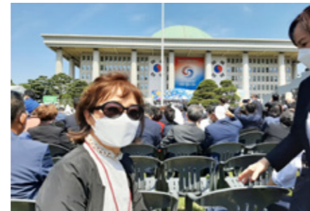
Die Autorin auf dem Festgelände vor dem Parlamentsgebäude

Für die 600 Gäste, die aus dem Ausland auf eigene Kosten angereist waren, gab es am nächsten Tag auf Einladung des Premierministers noch einen Empfang in einem berühmten Hotel in Seoul. Der neue Präsident überraschte