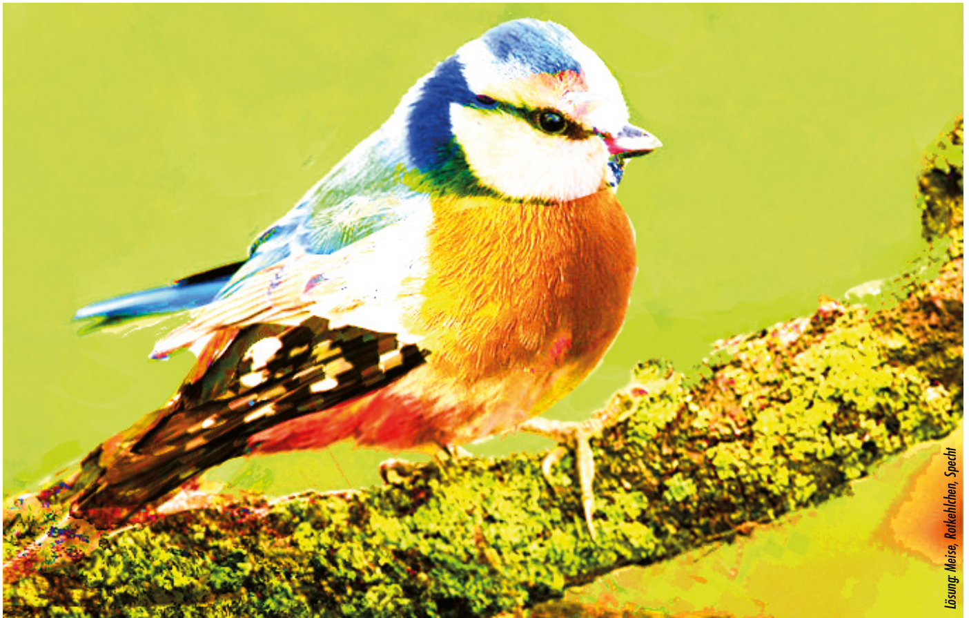
Lösung: Meise, Rotkehlchen, Specht

Hörst Du morgens auch ganz viele Vögel singen oder hüpfst Dir der ein oder andere Vogel über den Weg? Hier siehst Du einen „Mix-Max“-Vogel, der aus drei verschiedenen Exemplaren besteht. Erkennst Du, welche Vögel drinstecken? Du hast die Wahl zwischen Spatz, Meise, Amsel, Specht und Rotkehlchen. Zwei davon sind nicht enthalten.