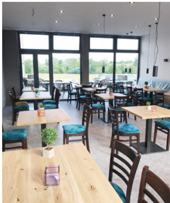
Gastrum mit Blick über die Terrasse