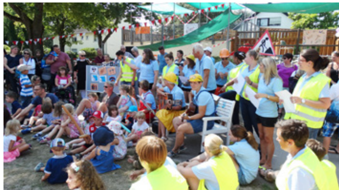
Solch eine Feier wünscht man sich!

Nach den Sommerferien 2023 am 16.09.2023 von 12:30 – 15:30 Uhr findet wieder das Sommerfest der Integrativen KiTa und Krippe HOPPETOSSE in Mainz-Bretzenheim statt.