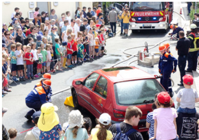
Übung der Jugendfeuerwehr

Der Schwerpunkt am Sonntag lag auf „Feuerwehr zum Anfassen“: An verschiedenen Stationen konnten die zahlreichen BesucherInnen Gerätschaft-