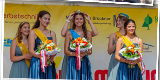
Die Krönung der neuen Brezelnfestmajestäten durch ihre Vorgängerinnen Foto: (6)