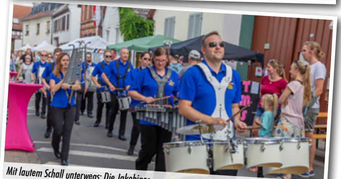
Mit lautem Schall unterwegs: Die Jakobiner