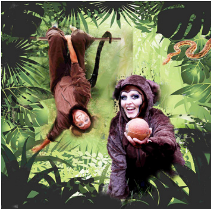
„Wer hat die Kokosnuss geklaut?“