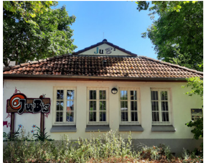
Das JuB's in Bretzenheim