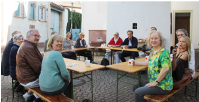
Zahlreiche VertreterInnen aus den Bretzenheimer Vereinen mit Landtagsabgeordnete Doris Ahnen (vorne im grünen Pullover)

In der Vorstellungsrunde, die die beeindruckende Vielfalt des Bretzenheimer Ehrenamtes zeigt, wird schnell klar, wo der Schuh drückt. Es fehlt an vielen Ecken am lieben Geld bzw. am niederschweligen Zugang zu Hilfs- und Fördermitteln. Noch mehr fehlt es den Bretzenheimer Vereinen an Räumlichkeiten, der Wunsch nach einem Bürgerhaus wurde aus unterschiedlichen Richtungen ausgesprochen. Auch die Sportvereine beklagen die immer knapper werdenden Hallenkapazitäten.