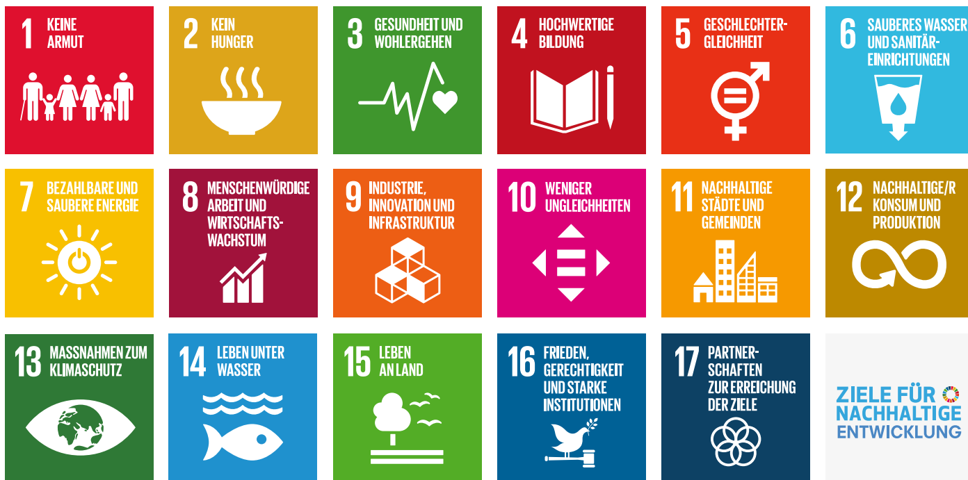
Die weltweit einheitlichen Symbole der 17 Ziele