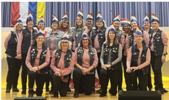
Die wilde Truppe der Schnattergänsjer – sauber aufgereiht

Am 13. Februar 2025 ab 18:33 Uhr heißt es wieder „Singt, lacht, schnattert, schunkelt und feiert mit den Bretzenummer Schnattergänsjer!“ Über 30 fastnachtsbegeisterte Frauen stellen seit nunmehr zwölf Jahren eine Frauenfastnachtsitzung auf die Beine und laden auch in der Kampagne 2025 zu einem kurzweiligen Abend in die TSG-Halle ein.