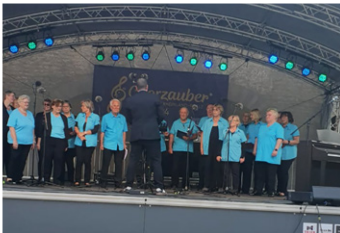
Der Auftritt der Dantesingers in Trier neben der Porta Nigra

Zwischen der Ankunft um 12 Uhr und unserem Auftritt wurde die Zeit genutzt, um Darbietungen anderer Chöre zu verfolgen oder sich Sehenswürdigkeiten der Stadt anzusehen. Wir hatten das Glück, auf der schönsten Bühne, der Kulturbühne im Brunnenhof, in unmittelbarer Nähe der Porta Nigra, aufzutreten zu dürfen.